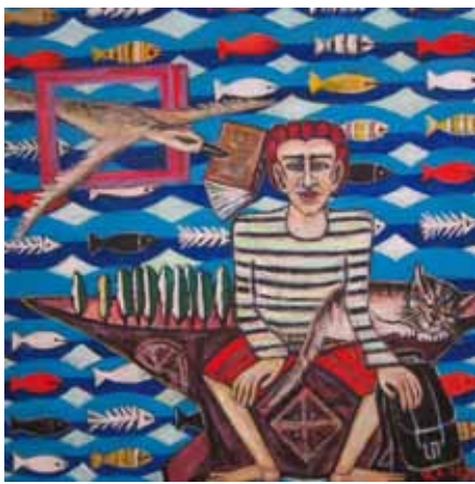
„Das Buch des Lebens“ Öl und Acryl auf Leinwand, 100x100 cm (2024)