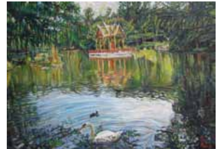
„Ruhe in der Natur“ Öl/Acryl auf Leinwand, 100x70 cm (2014)

Bilder unten von li. nach re.: „Die Leichtigkeit des Seins“ Öl auf Leinwand, 75x100 cm (2023) „Auswählen 4“ Öl/Acryl auf Leinwand, 50x70 cm; „Auswählen“ 50x70 cm (2015)