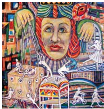
„Marionettenspieler“ Öl und Acryl auf Leinwand, 100x100 cm (2022)

Titelbild: „Winter im Nymphenburger Schlosspark“ Öl /Acryl auf Leinwand, 80x60 cm (2013)