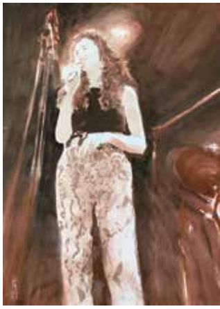
Fernanda von Sachsen Gessaphe @ Milla Club, 2023, Gouache und Aquarell (60 x 42cm), Wachsfirniss, ungerahmt