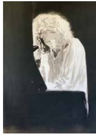
Pablo Struff @ the Milla Club, 2023, Aquarell und Gouache (60 x 42cm), Wachsfirniss, ungerahmt