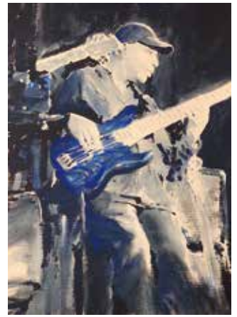
Raoul Walton @ Jazzclub Unterfahrt, 2023, Gouache und Aquarell (70 x 50cm), mit Wachsfirniss versiegelt, ungerahmt